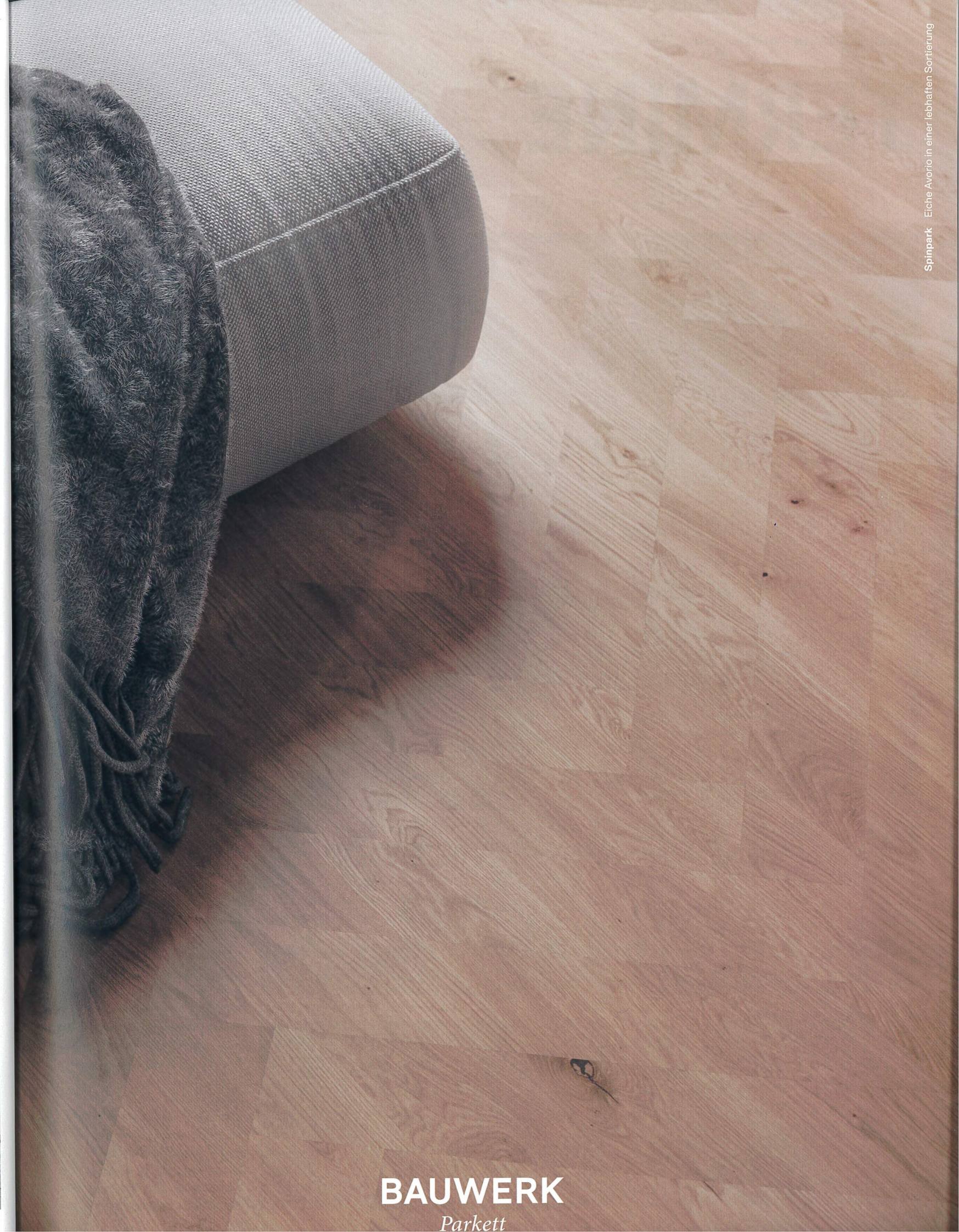
Spinpark - Eiche Avorio in einer lebhaften Sortierung