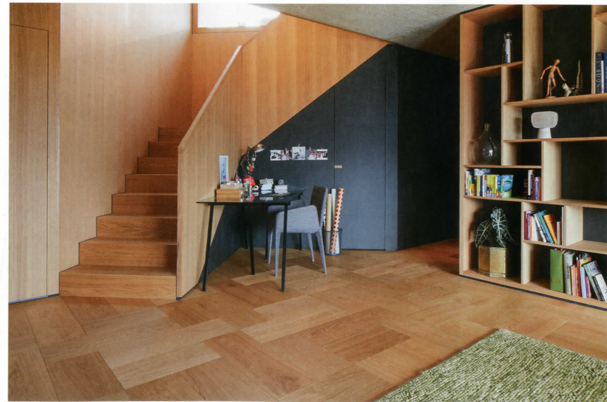
Der Innenausbau wirkt dank Einbauschränken in Eichenholz und Linoleum wie aus einem Guss.