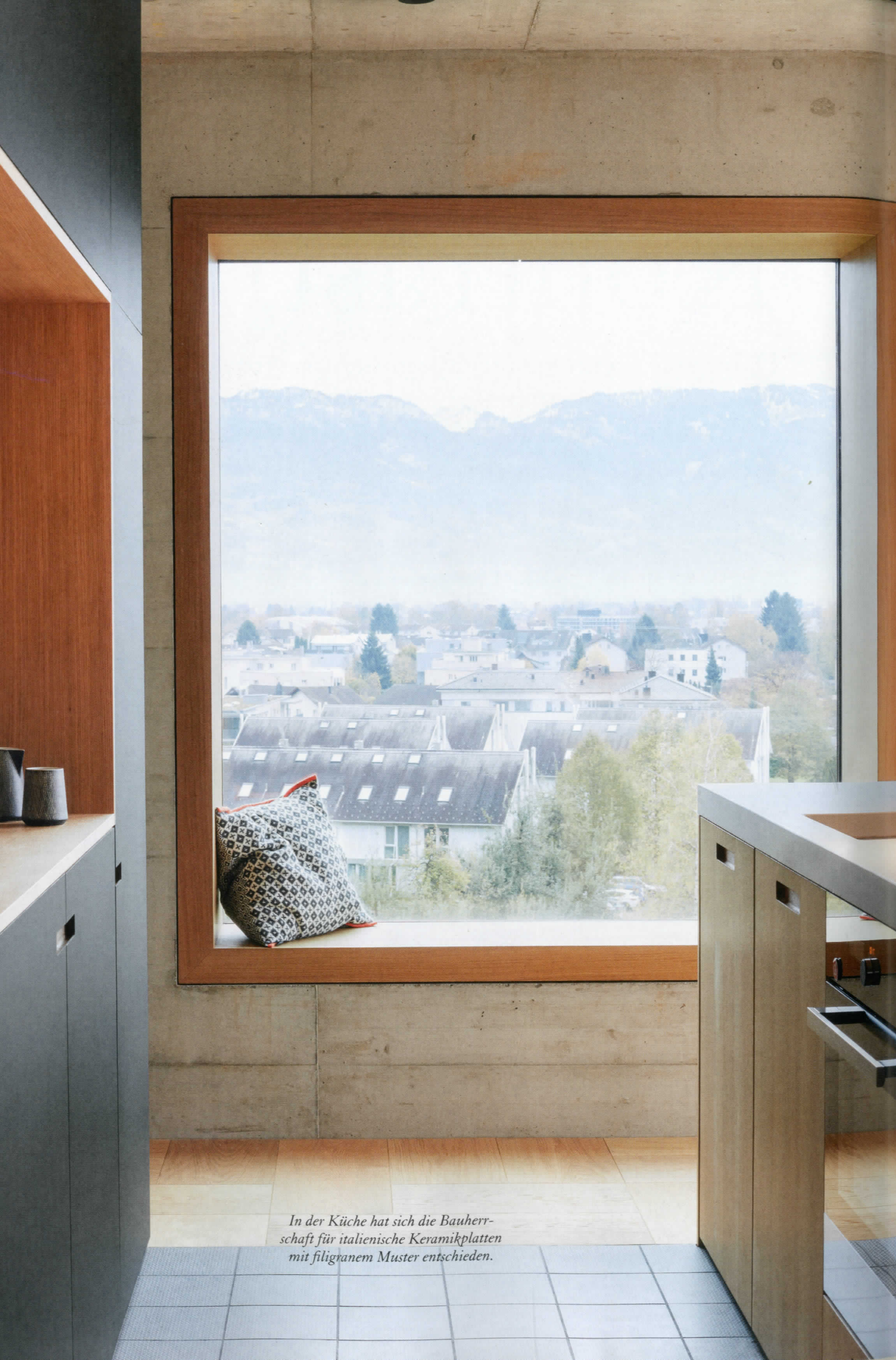
In der Küche hat sich die Bauherrschaft für italienische Keramikplatten mit filigranem Muster entschieden.